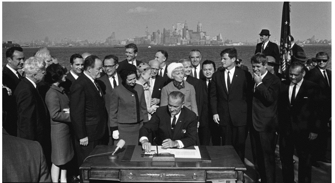
美国历史上最悲伤的一天。约翰逊总统与肯尼迪总统和前总统胡佛一起,将美国交给墨西哥——1965年10月3日

美国和世界正处于人口过度增长的崩溃过程中,其中大多数在上个世纪,现在全部归功于第三世界人民。消耗资源,增加40亿人口,将崩溃工业文明,带来惊人的饥饿、疾病、暴力和战争。地球每年至少损失1%的表土,因此,当它接近2100年时,大部分粮食的生长能力将消失。数十亿将死去,核战争几乎可以肯定。在美国,由于大规模移民和移民再生产,加上民主带来的滥用,这大大加速了这一点。堕落的人性无情地把民主和多样性的梦想变成了犯罪和贫穷的恶梦。只要中国坚持限制自私的独裁统治,中国将继续压倒美国和世界。崩溃的根本原因是我们与生俱来的心理无法适应现代世界,这导致人们把不相干的人当作他们共同的利益对待。人权观念是左派分子宣扬的邪恶幻想,旨在转移人们对无节制的第三世界母性无情毁灭地球的注意力。再加上对基础生物学和心理学的无知,导致部分受过教育的控制民主社会的人产生社会工程错觉。很少有人明白,如果你帮助一个人,你伤害了别人——没有免费的午餐,任何人消耗的每一件东西都会破坏无法修复的地球。因此,各地的社会政策是不可持续的,一个个、没有严格控制自私的社会将崩溃为无政府状态或独裁。最基本的事实几乎从未提及过,即美国或世界上没有足够的资源来使相当一部分穷人摆脱贫困并使他们继续生活。这样做的企图正在使美国破产,毁灭世界。地球生产食物的能力每天都在下降,我们的遗传质量也是如此。现在,和往常一样,穷人最大的敌人是其他穷人,而不是富人。如果不进行戏剧性和立即的变化,就不可能阻止美国或任何遵循民主制度的国家的崩溃。