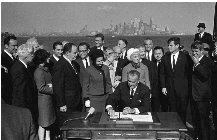
Il giorno più triste della storia degli Stati Uniti. Il presidente Johnson, con 2 Kennedy ed ex presidente Hoover, dà l'America al Messico - 3 ottobre 1965