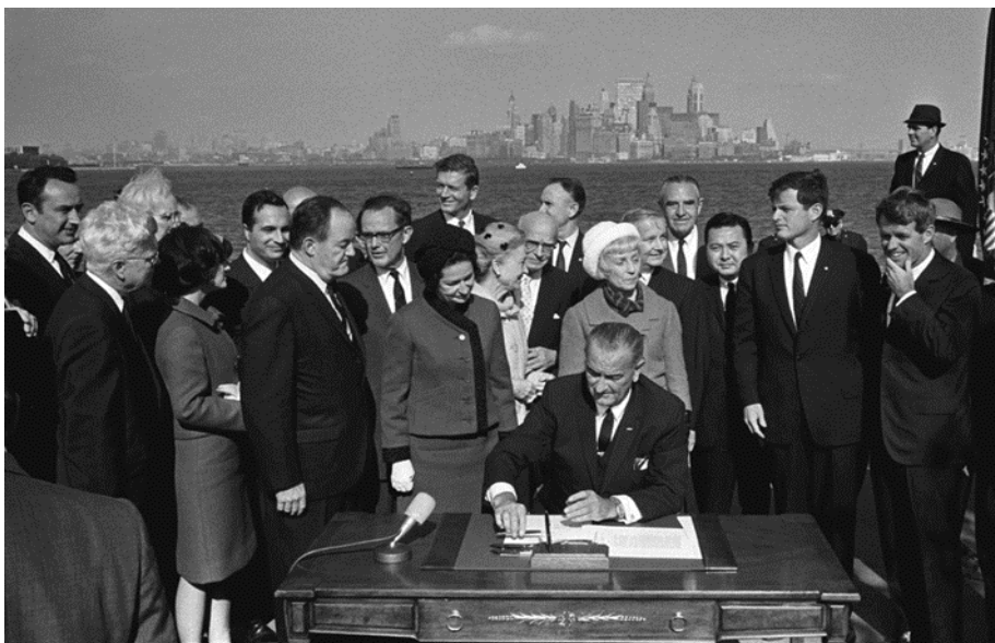
Il giorno più triste della storia degli Stati Uniti. Il presidente Johnson, con 2 Kennedy ed ex presidente Hoover, dà l'America al Messico - 3 ottobre 1965