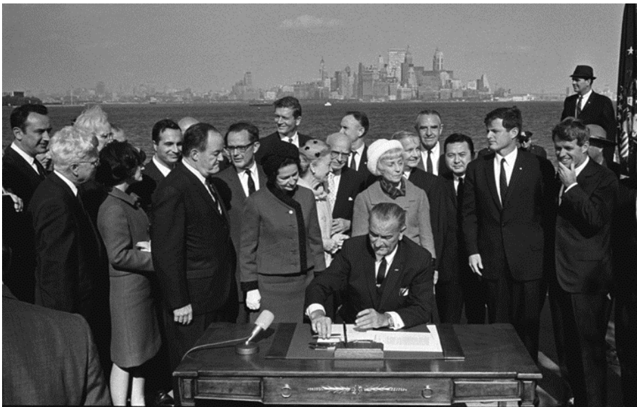
Najsmutniejszy dzień w historii USA. Prezydent Johnson, z 2 Kennedy'ego i byłego prezydenta Hoovera, daje Amerykę Do Meksyku - 3 października 1965