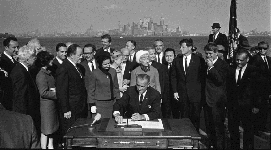
Der traurigste Tag in der US-Geschichte. Präsident Johnson, mit 2 Kennedys und Ex-Präsident Hoover, gibt Amerika an Mexiko - 3. Oktober 1965