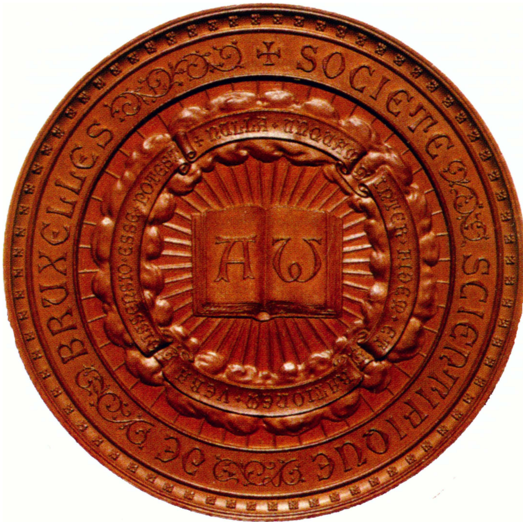
Médaille de la Société scientifique de Bruxelles (KBR, Cabinet des Médailles, Bruxelles)