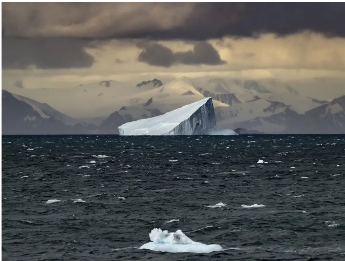
Tảng băng nổi quan sát được ở Nam Cực tháng 2/2022

Nói tới vùng giá lạnh của địa cầu, thường ta nghĩ ngay tới Bắc Cực và Nam Cực. Nhưng tới nay, hai châu lục vốn ít chịu chi phối bởi các ý niệm địa chính trị và được hình dung bởi nhiệt độ giá rét khắc nghiệt, lại đang chứng kiến tốc độ tăng nhiệt độ cao nhất, so với phần còn lại của trái đất. Riêng Nam Cực có tốc độ nóng lên nhanh gấp đôi so với mức trung bình toàn cầu.