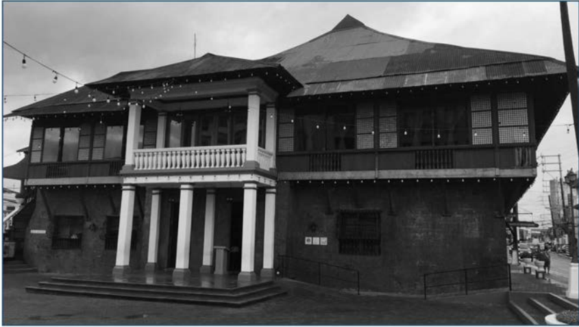
Larawan 2. Tahanan ng mga Guevara sa Sta. Elena, Marikina City. Nagsilbi rin itong paaralan, kuta ng mga sundalo, ospital, at iba pa. Sa ngayon, maituturing na ito bilang Pambansang Yamang Kultural ng Marikina. noong Oktubre 11, 2020.