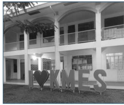
Larawan 14. Kapitan Moy Elementary School.

noon ang mismong tahanan ni Kapitan Moy pagkatapos itong idoneyt ng angkan sa pamahalaan noong Marso 11, 1912 (KMES, w.tn). Naging ganap na paaralang elementarya ang Kapitan Moy noong Hunyo 4, 1976 (KMES, w.tn). Sa pagdaan ng panahon, inilipat ang Paaralang Kapitan Moy sa pinaghahatiang espasyo nito sa Marikina Elementary School bago ang taóng 2000 (Basijan, 2020). Kinalauna’y inilipat muli ang Paaralang Kapitan Moy malapit sa/mismo sa Marikina Heights High School (na itinayo naman noong Mayo 30, 2000 at naging hiwalay na paaralan noong Marso 2, 2004) (MHHS, 2004). Sa ngayon, isa nang hiwalay na paaralan ang Kapitan Moy Elementary School [cf. Larawan 14]. Patunay ang paaralang ito sa naging kontribusyon at pagkilala kay Kapitan Moy ng mga Mariqueño.