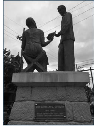
Larawan 12. Monumento ni Kapitan Moy. Kuhang larawan ng may-akda noong Oktubre 11, 2020.