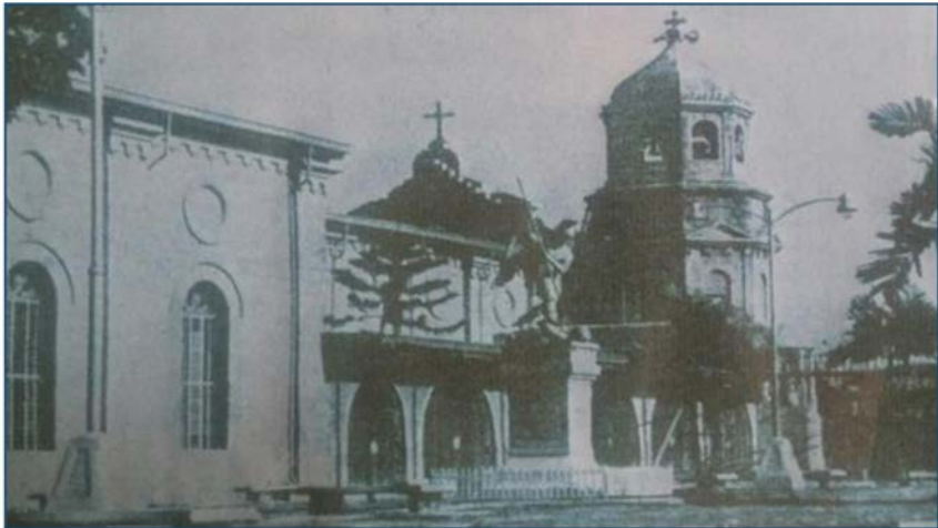
Larawan 3. Nuestra Señora delos Desamparados (1690). Ayon sa matandang kasulatan, ang simbahang ito ay unang ipinatayo ng mga Agustino noong 1572. Ito ay yari lámang sa kawayan at pawid. Naisagawa ang unang misa sa Mariquina nang ang visita ay nasa Jesus Dela Peña pa lámang noong Abril 16, 1630. Ipinagawa ang simbahang bato noong 1687; naging ganap na parokya noong 1690 at nasunog sa panahon ng mga digmaan laban sa mga Español at mga Amerikano.