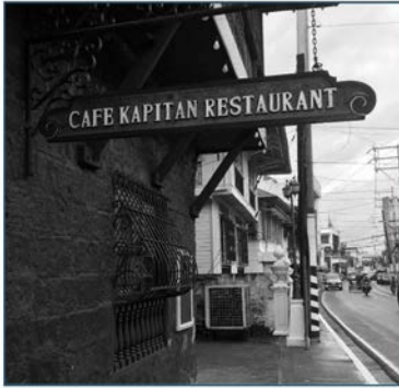
Larawan 13. Café Kapitan Restaurant.