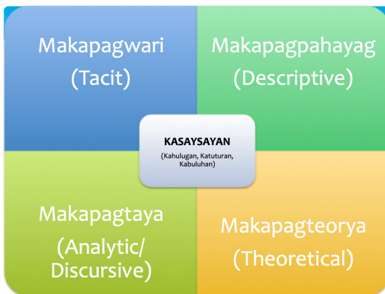
Dayagram 2 Kahulugan, Katuturan, at Kabuluhang Pangkasaysaya

Tumutukoy ang una sa uri ng kaalamang pangkasaysayan na bunga ng ating personal na danas at natatanging konteksto kaugnay sa kalakarang panlipunan at kaganapang pangkasaysayan sa isang partikular na dako at panahon na pinagkapookan ng naisaprosesong implisitong kaalaman—na taliwas kung tutuusin sa pormal, kodipikadong kaalamang pangkasaysayan—kaalamang pangkasaysayan na sadyang may kahirapang maisasalin o makatas sa pamamagitan ng pasulat o pasalita mang anyo ng pagsasakaysayan. Kung bakit sapagkat ito ay naglalaman ng pansariling danas at nagtataglay kung gayon ng mga madamdaming salaysay o naratibo sa aktor o tagaganap ng kasaysayan.