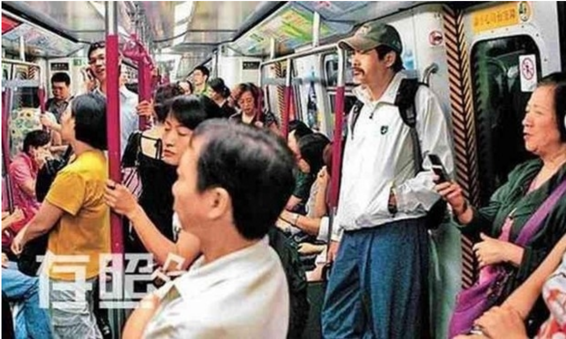
Châu Nhuận Phát, tài tử điện ảnh hiến tặng gần 1 tỷ đôla cho từ thiện và sống cuộc đời bình dị.

Việc có thể chỉ ra những luận điểm về giá trị cũng như khả năng tác động và hướng có thể xây dựng những chương trình có thể vận hành, xoay quanh những minh tinh màn bạc, để thúc đẩy nỗ lực tạo dựng kiến thức, thái độ, và hành vi cho bảo vệ môi sinh rõ ràng mang lại những giá trị lớn, tiềm tàng, và hiện tại chưa được sử dụng hiệu quả.