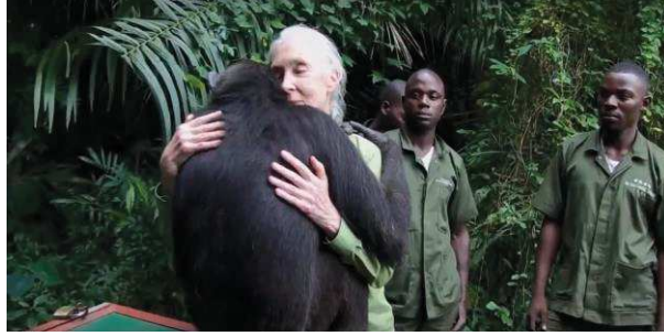
Görsel 2. Serbest Bırakılma ve Sarılma Anları